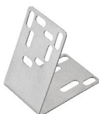
Montagewinkel für Cube Art.-Nr. 8605963